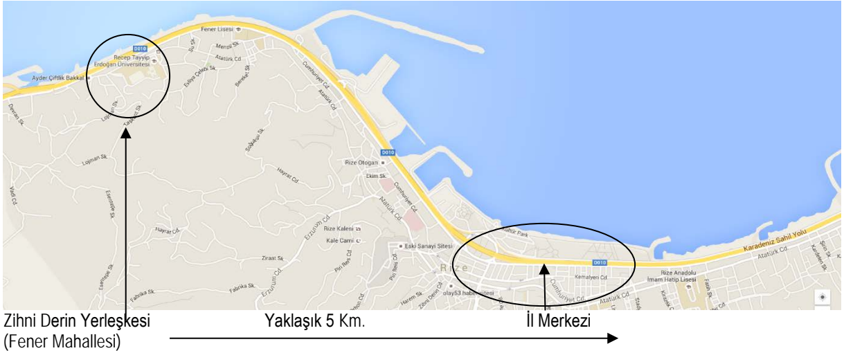
Harita 1: RTEÜ Zihni Derin Yerleşkesi

ADRES: Recep Tayyip Erdoğan Üniversitesi, Spor Bilimleri Fakültesi, Zihni Derin Yerleşkesi, 53100, Fener Mahallesi, Merkez/RİZE